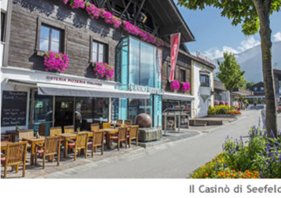
Il Casinò di Seefeld

Il 27° Campionato Italiano di Backgammon e il XVII Austrian Backgammon Open al Casinò di Seefeld