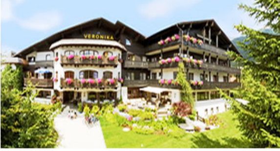
L'Hotel Veronika, Seefeld